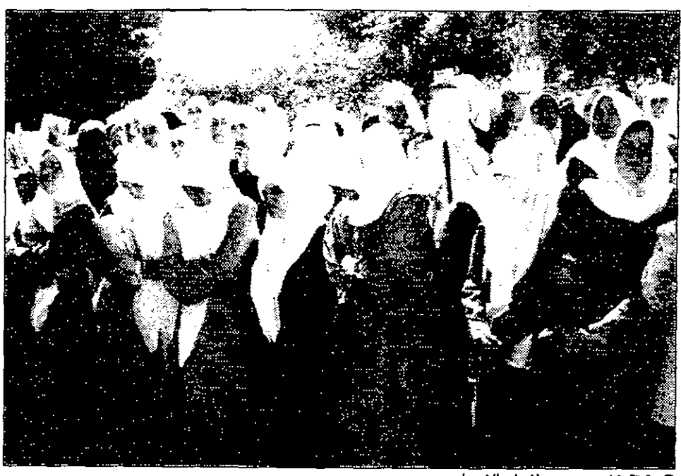
تفجئة خضوع وصمت لارواح الشهداء